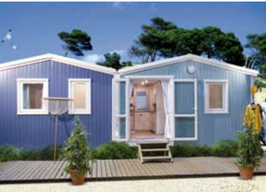
Cabane du pêcheur