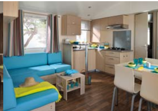
Façades laquées et finitions raffinées Dressing incorporé dans la chambre (zoom)